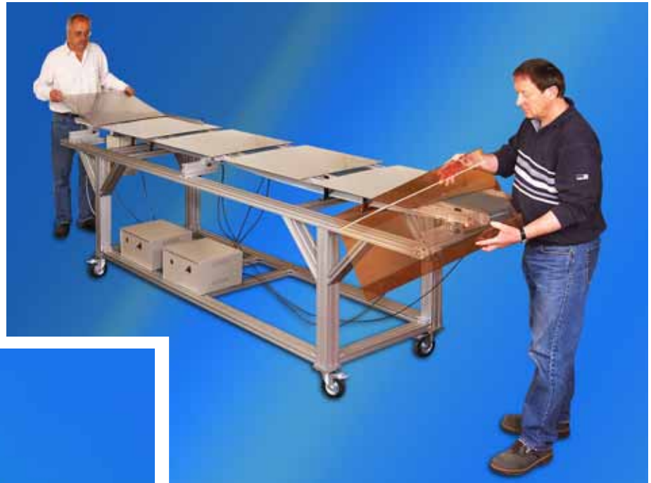
Auflegen, Abnehmen, Biegen

Während des Transports wird der Zuschnitt links und rechts des Bandes erwärmt. Beispiel: Heizzeit 60 sec, alle 12 sec ein biegefähiges Teil.